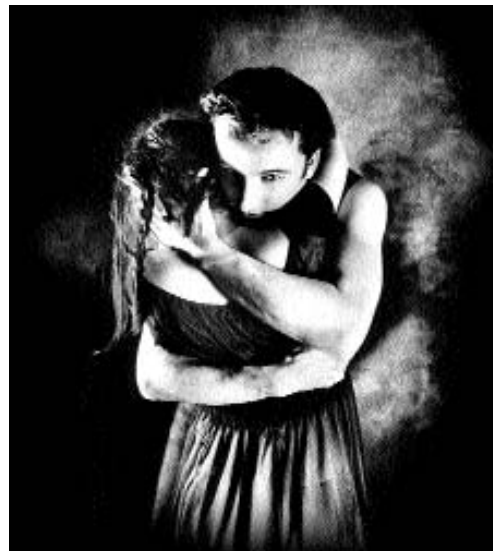
La compagnie de danse québécoise Cas Public se produit pour sept représentations.

Les danseurs, narrateurs du conte, commencent à improviser une histoire invraisemblable sur une princesse blonde qui porte des chaussures de verre, vit dans un château de pain d'épice, mange une fenêtrée en chocolat et ...tombe dans le coma. Après mille ans de sommeil " pour se réveiller, elle embrasse les trois petits cochons. " Les comédiens répètent certaines phrases les uns après les autres et se chamaillent, désamorçant à l'avance l'horreur de l'œuvre originale. Un parterre de plumes écarlates évoque le sang des victimes mais, quand les artistes s'en saisissent et les lancent dans la lumière, toute gravité s'envole avec elles. Lorsque la troupe enchaîne avec une deuxième version du conte - celle d'Anatole France - une nouvelle piste de réflexion s'offre aux jeunes spectateurs. " Nous avons tous en nous un ange comme Jeanne et un Barbe Bleue, souligne Hélène Blackburn avec malice. Nous sommes gentils, et parfois moins. Il faut apprendre à vivre avec ça le plus tôt possible! " La chorégraphe compose avec la société et avec son temps. Les américains boudent barbe Bleue? Elle le joue ailleurs. Et les enfants de France, selon elle, sont éduqués dans un esprit précieux d'ouverture. " Dans ce pays où beaucoup de nationalités cohabitent, l'idée de développer une culture forte est une vraie méthode d'intégration."